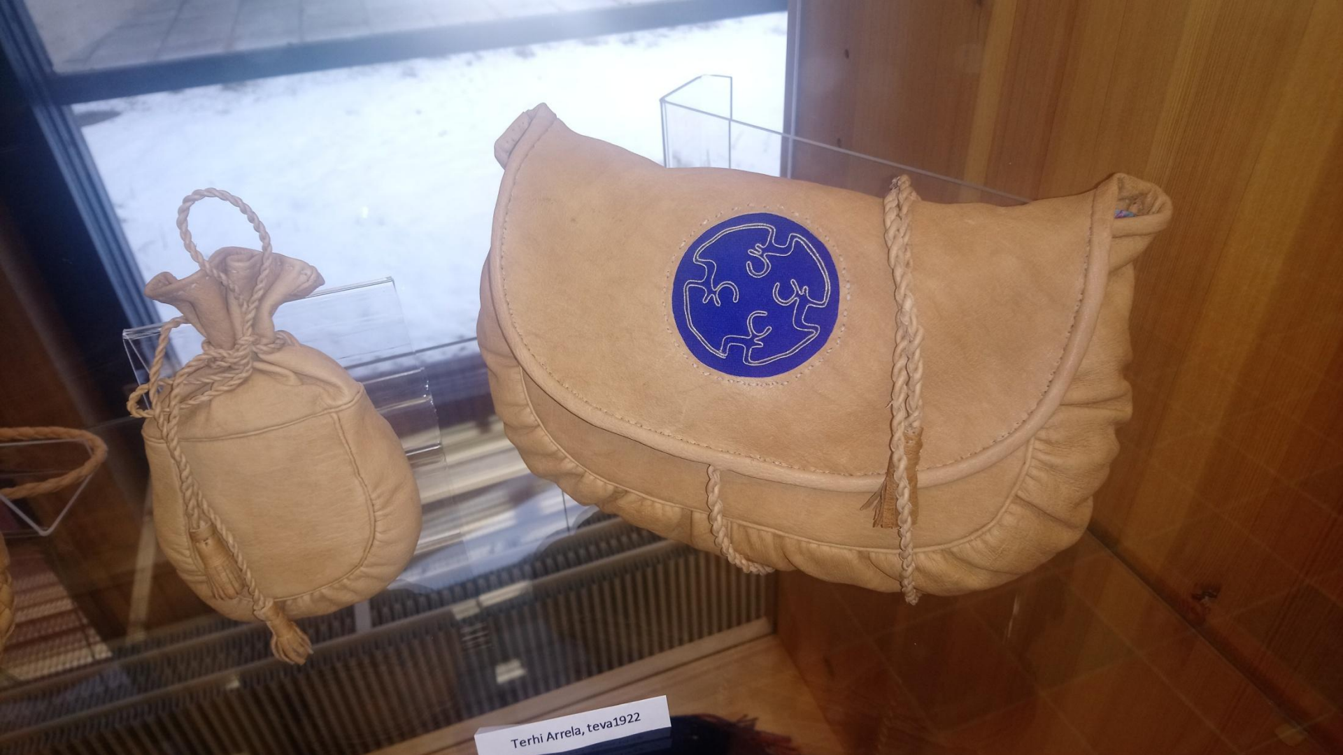
Terhi Arrela, teva1922